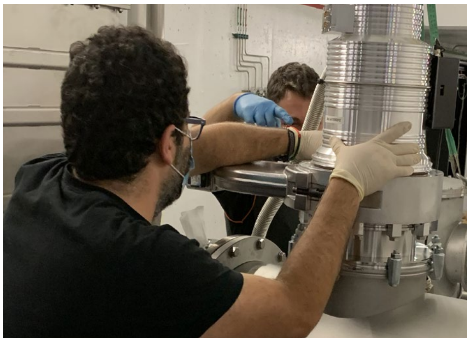
Instalación en el área de experimentación tras concluir el estado de alarma.

Debido al estado de alarma para la gestión de la situación de crisis sanitaria, que se declaró en el país el pasado 14 de marzo y concluyó el 21 de junio de 2020 (RD 463/2020, RD 476/2020, RD 487/2020 y RD 555/2020), el Centro de Láseres Pulsados, como otras muchas instituciones científicas y de investigación, tuvo que cerrar sus puertas. Aunque esto no significó el cese total de sus actividades, ya que los trabajadores de la infraestructura siguieron su labor desde sus casas, sí postpuso importantes eventos como las campañas experimentales previstas para mayo y junio, o la publicación de la tercera convocatoria para el acceso a su sistema láser de petavatio VEGA. Concluido el estado de alarma, el CLPU dispuso todo para reabrir sus puertas y retomar su actividad diaria. Para ello diseñó y validó un protocolo de prevención que permitió la incorporación paulatina de trabajadores en el marco de las normas de seguridad impuestas por las autoridades. De esta manera, desde finales de junio, los trabajadores del Centro de Láseres Pulsados han alternado la modalidad presencial con el teletrabajo logrando reactivar el desarrollo normal